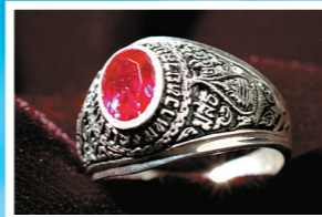
แบบหัววงรี ประดับพลอย