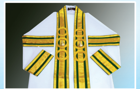
ครุฑุภุบัณฑิต

มีวงกลมข้างละ 2 วง มีเข็มตรามหาวิทยาลัย ติดบนสำรดในวงกลม วงบนทั้งสองข้างของหน้าอก