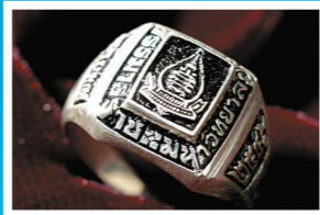
แบบหัวตัด ไม่ประดับพลอย