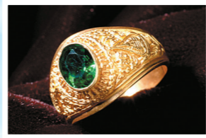
แบบหัววงรี ประดับพลอย

สมาคมสุโขทัยธรรมาราชได้จัดทำแหวนรุ่น 2 ชนิด คือ แหวนเงินรมดำและแหวนทองคำ ซึ่งมี 2 แบบ คือ 1. แบบหัวตัด ไม่ประดับพลอย หน้าเล็กและหน้าใหญ่ 2. แบบหัววงรีประดับพลอย หน้าเล็กและหน้าใหญ่