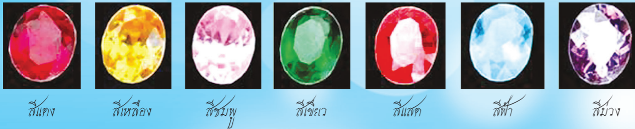
สีแดง สีเหลือง สีม่วง สีเขียว สีแสด สีฟ้า สีม่วง

เฉพาะแหวนรุ่นทองคำ แบบหัววงรีประดับพลอย มีพลอยให้เลือกหลากสี ได้แก่ สีน้ำเงิน และสีประจำวันเกิด (7 สี)