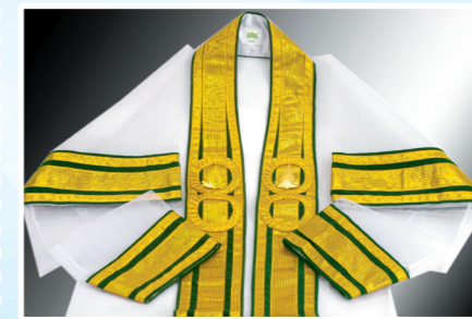
ครุฑมหาบัณฑิต

มีวงกลมข้างละ 1 วง มีเข็มตรามหาวิทยาลัย ติดบนสำรดในวงกลม ทั้งสองข้างของหน้าอก