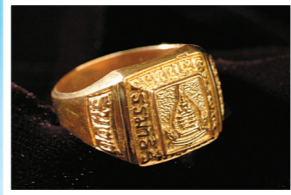
แบบหัวตัด ไม่ประดับพลอย