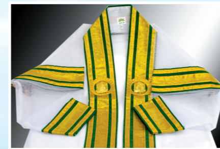
ครุฑบัณฑิต

ครุฑบัณฑิต ครุฑมหาบัณฑิต และครุฑุภุบัณฑิต มีลักษณะคล้ายกัน จะแตกต่างกันเล็กน้อย ดังนี้